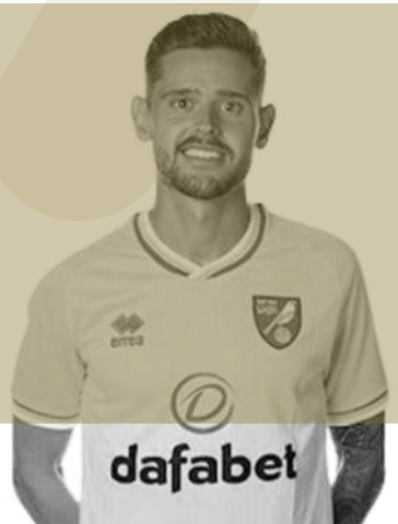
NORWICH X. QUINTILLÀ